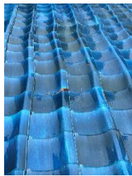
↑↓瓦がズレています

築50年以上で瓦屋根のお家のほとんどが『土葺き工法』です。気になる方は、一度点検されることをおすすめします！早めの対応で、修理で済むこともあります。