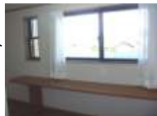
窓からは若草山が一望→